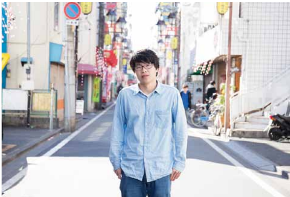
中国吉林省出身。21歳

中国では高校での部活動はないと思う。朝の7時から夜の9時まで授業があるから。バイトもできない。先生は、自分のクラスから優秀な子を出すほど、給料が上がるので、一生懸命教えてくれる。先生が来なくても別の先生が来て教えるので、一日ずっと勉強している。僕はほとんど勉強せず、教室の後ろで寝ていた。夜通しパソコンで遊んで、朝に寝る生活をしていたら、勉強ができなくなって親が日本に連れて行っ