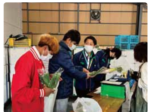
お手伝いお疲れさまでした。