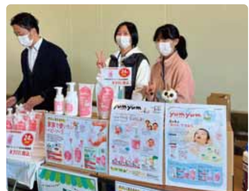
販売のお仕事がんばりました！