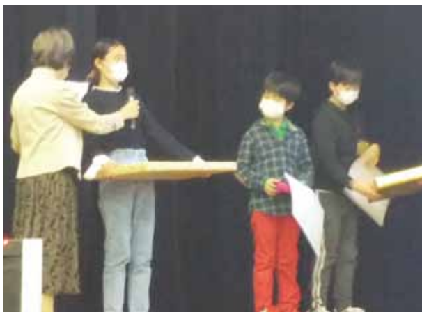
インタビューに答える子どもたち

ご協力くださった二市一町の関係者のみなさま、この事業の助成をしてくださった「公益財団法人つなぐいのち財団」にお礼を申し上げます。