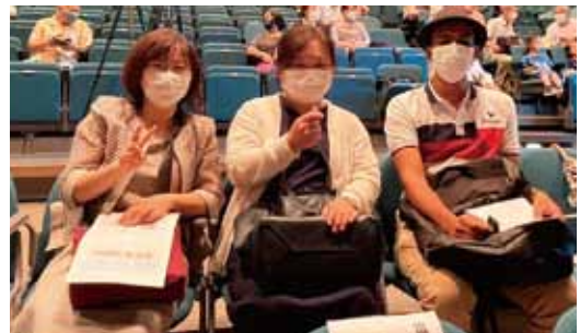
講演の出演者のみなさん、お疲れさまでした！

富士見市太鼓の会演奏、やさしい日本語講座、弦楽四重奏による世界の音楽演奏なども行われました。セルビアフェスタの一環で、セルビアのお菓子プレゼントなども配られました。(茂木久美子)