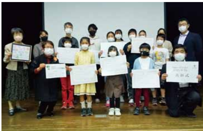
子どもクラブ担当のスタッフは、子どもたちからお礼の色紙をもらいました