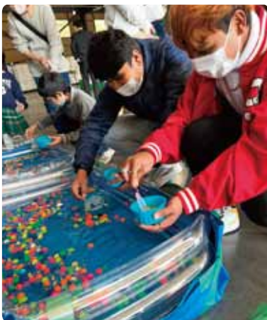
ゲームも全力で取り組みます

パルシステムとFICECとのコラボが実現しました。11月19日(土)に、パル・マルシェ(産業祭)のお手伝いに行ってきました。受付と野菜の販売の仕事をしました。参加者は、国際子どもクラブに所属する5人の若者です。中国語とネパール語でのチラシも作っていただきました。(山畑博子)