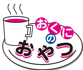
okuni no oyatsu

皆様が取り組まれている活動をネパールの友人に紹介したら、きっと感謝されると思います。わたしも微力ですが、皆様のお役に立てますよう頑張りますので、よろしく願いいたします。