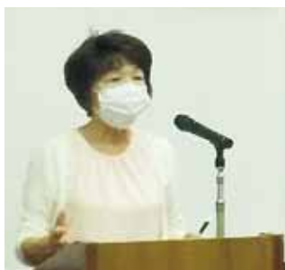
事業報告を行いました

総会には正会員49名が出席して2021年度事業報告・会計報告、2022年度事業計画・予算案、定款変更、役員改選などすべての議案が可決承認されました。また総会前には外国ルーツの子どもたちによる絵コンテストの受賞者表彰が行われました。